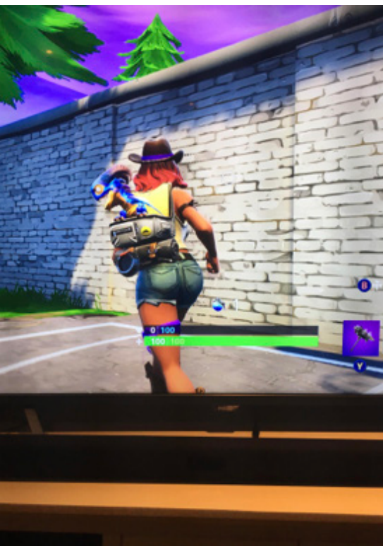
Her er en typisk spillkarakter i fortnite som vi ofte spiller.

Hei mine venner og en riktig god jul til dere alle sammen.