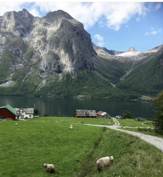
Postkortmotiv, ja, men det som ikke kommer fram av bildet er den betydelige mengden med avføring som ligger overalt.

Et annet aspekt med å bygge på landet er dette med markedsverdi på huset. Det kan sammenlignes med en ny bil, med det samme en starter bilen for første gang, faller bilen 20 % i verdi, dette gjelder også nye hus på bygda. Bygger man for 5 millioner, får du maks 3 millioner igjen ved et eventuelt salg, hvis du er så heldig å få solgt i det hele tatt. Når kontrakten for huset er signert har en kommet i en situasjon som kalles PONR, altså «Point of no return». Dette stadiet i livet vil for mange føre til mange søvnløse netter og tidvis situasjoner hvor en ligger i fosterstilling og skjelver.