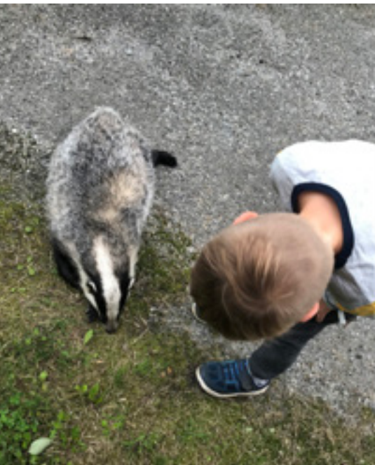
Liten anatomi leksjon på død grevling.

Veien til barnehagen kan være en utfordring, både vinterstid og sommertid. Vi er så heldig at vi er pålagt av kommunen å ha registrert beredskapshjem for ungene i bygda, hvis veien til Vike er stengt i forbindelse med ras, både snø og stein. Men det ikke bare slike utfordringer på veien til barnehagen, det mange hjorter og rådyr som finner det for godt å hoppe ut i veien, noen er også så utspekulert at dem hopper direkte inn i bilsiden. Hvis dette skjer så vet man at dagen kan ikke bli verre.