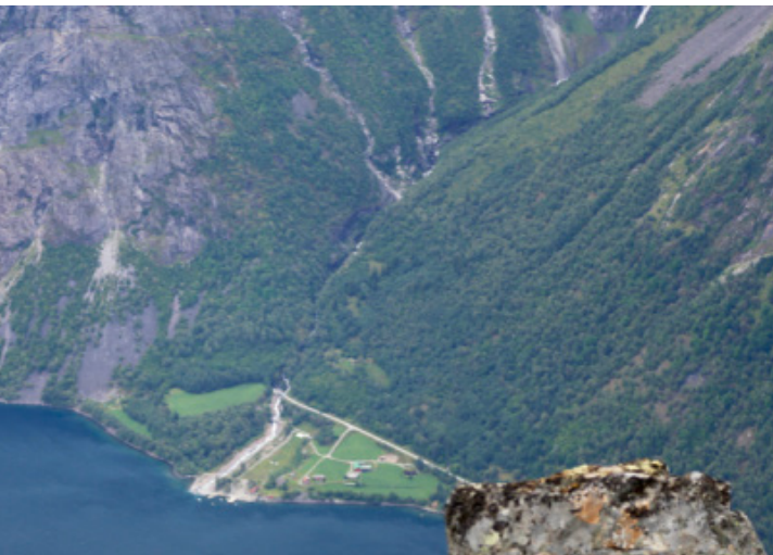
Vike sett fra 1734 moh/Hoemtinden.

Desember 2016 var vi dritlei av regn, bomringer, rushtid og kø, vi flytter til Vike. Vi startet prosessen med å si opp jobber, snakke med megler, si opp barnehage og pakke. For hver ting vi pakket ned merket vi at pulsen steg og usikkerheten kom snikene, skal vi virkelig kutte navlestrengen til Bergen og hele vårt sikkerhetsnett? Såklart, var min første tanke, aldri har jeg vært mer sikker i mitt liv, jeg visste faen ikke hva jeg gikk til.