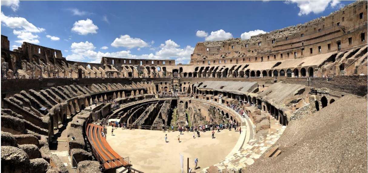
Bilde 8: Tur på Colloseum, med medbrakt guide i tillegg til innleid