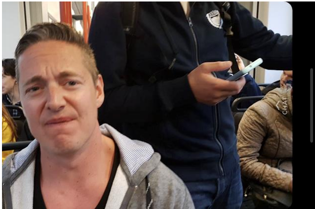
Bilde 1: Godt med forfriskninger på bybanen.