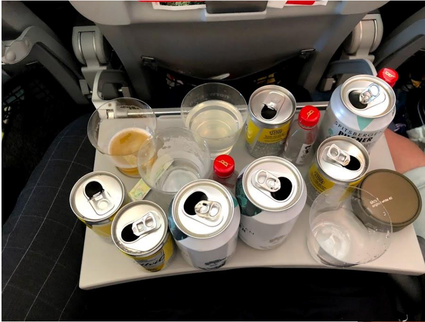
Bilde 4: Gjett hvem sitt bord?