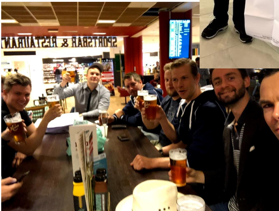
Bilde 3: Måltid og leskende drikker på Flesland. Inndeling i lag. Lagene fylte ut betting-skjema for resultater i fotball-VM samme helgen som Roma-turen.