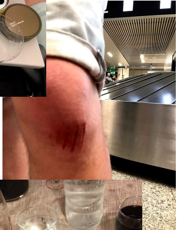
Bilde 5: Hendelig uhell på flyplassen i Roma