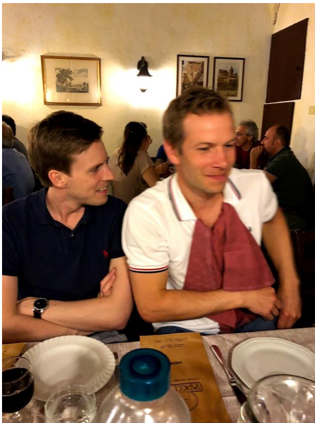
Bilde 7: Beskjedne porsjoner