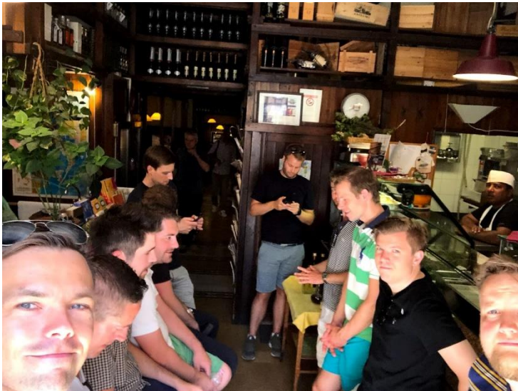
Bilde 11: Vinkeler fra second floor